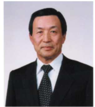
横断型基幹科学技術推進協議会