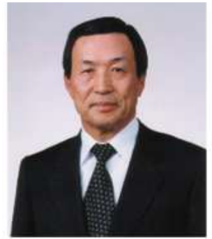
横断型基幹科学技術推進協議会